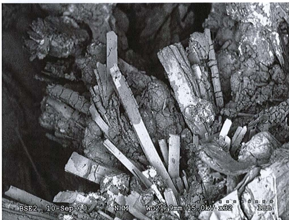
Fig. 3. Sveinbergeitt, Buer, Vesterøya, Sandefjord. Langprismatiske, tavleformete ca. 2 mm lange krystaller.