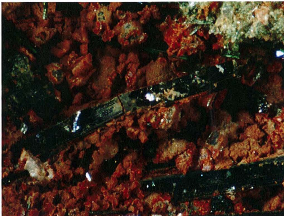
Fig. 2. Sveinbergeitt, Buer, Vesterøya. Langprismatiske, tavleformete ca. 2 mm lange krystaller. Samling: Svein A. Berge.