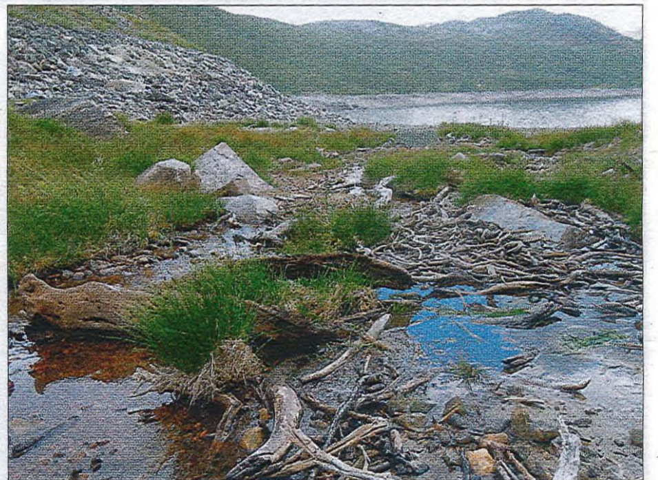
STRANDAVATN: Sommaren 2015 vart ein ny sopptype registrert ved Strandavatn, på grensa til i Hallingskarvet Nasjonalpark.