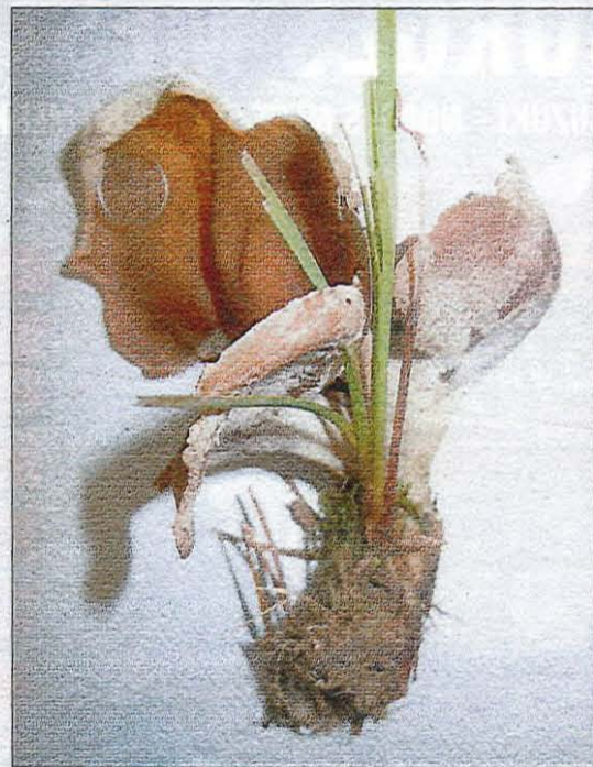
STOR ALPIN SOPP: Den nyoppdaga soppen er forholdsvis stor med sine åtte centimeter.