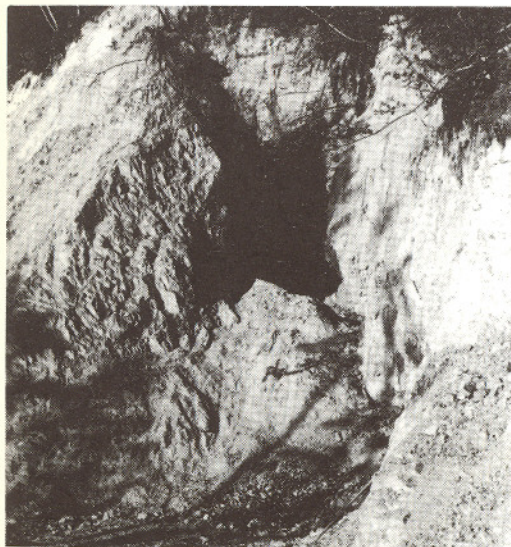
Tveitsto Flusspatgruve. Den øvre stollen.

Litteratur: Falck-Muus, Rolf: Brynesteinsindustrien i Telemarken. Norges geologiske undersøkelse nr. 87, årbok for 1920 og 21, 1922.