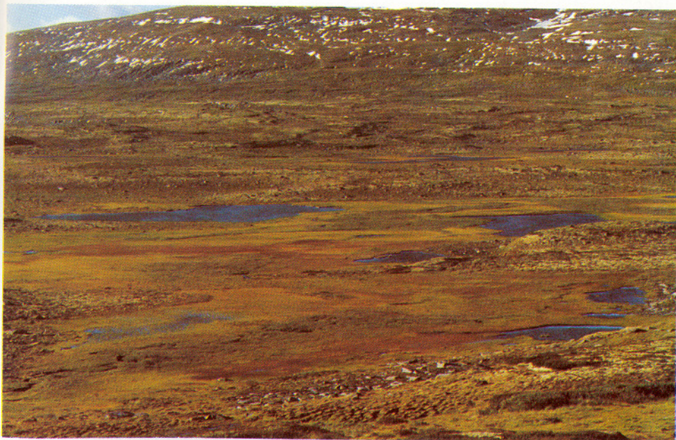
I dette området ble løsblokken funnet