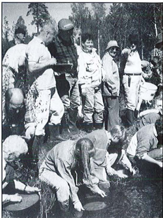
Foreningen på gulljakt

Vi synes alle at for den som en gang er blitt bitt av steinbasillen, er det ingen fine- re hobby enn amatørgeologi.