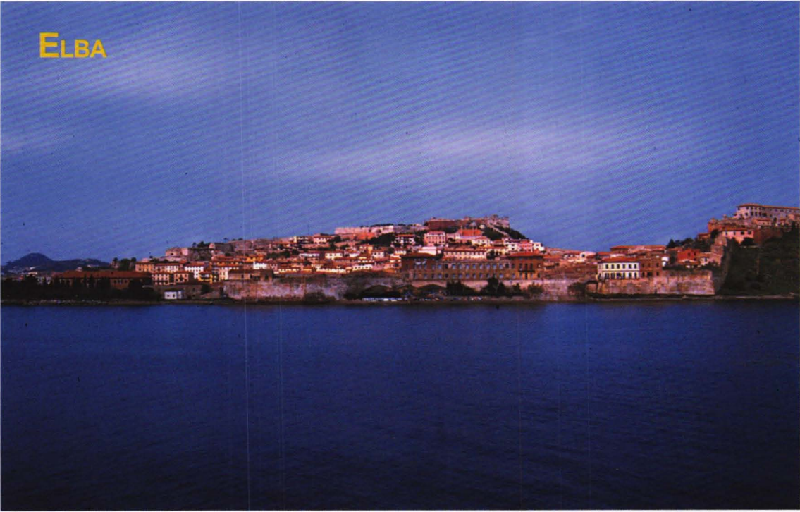
Havneparti ved Porto Feraio