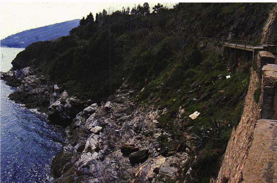
Hedenbergitt- og ilvittforekomsten ved Rio Marina

en del med granitter og en del med skarnbergarter. I skarnbergartene finnes det flere rike hematittmineraliseringer og disse har vært drevet i 3000 år. Den mest kjente er på åsen nord for Rio Marina. Her er det et