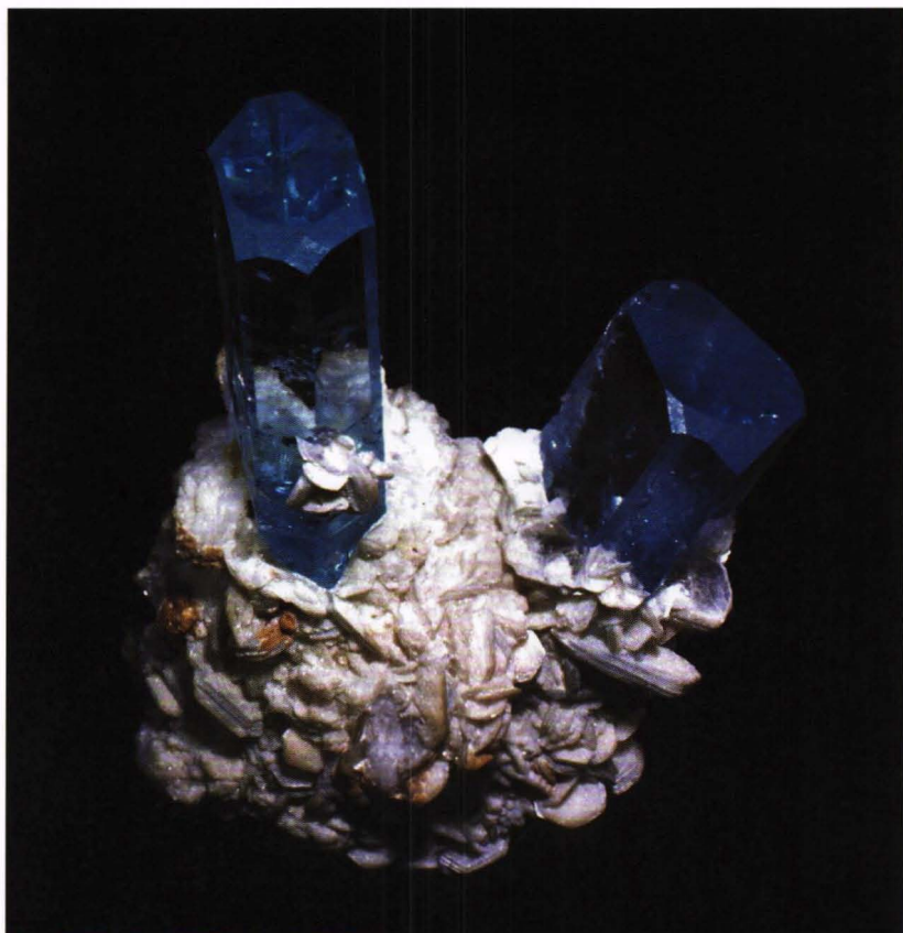
Akvamarin fra, 7 x 5 cm fra Nagar, Pakistan.