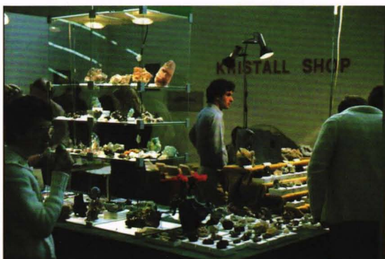
Fra en mineralmesse

Det arrangeres messer for steininteresserte i de fleste land – i noen land er den messer hver eneste helg! Bode Verlag i Tyskland utgir et "Sammler-Info" som bilag til "Mineralienwelt" med oversikt over de