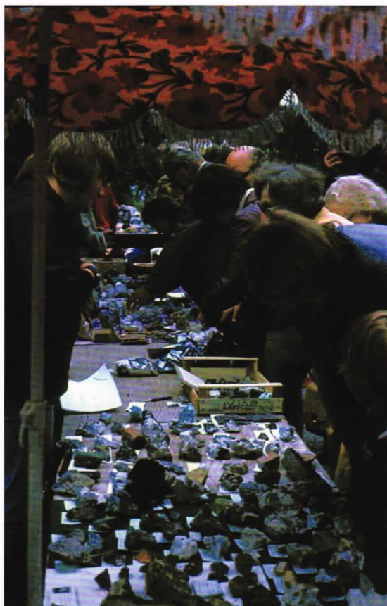
Fra steinmesse i Norilsk, Russland.

Fra forfatteren av denne artikkelen fikk jeg dette hyggelige julekortet i min e-postkasse sist jul. Fin måte å fortelle om siste års anskaffelser på. Red.