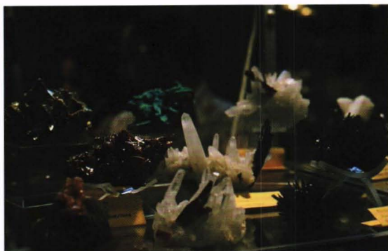
Her er mange superstuffer.