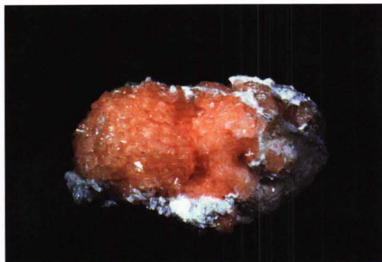
Poldervaartitt 7 x 4 cm fra Sør-Afrika.

nale steinmesser; bl.a. Bologna i Italia i mars, Kopparberg i Sverige i midten av juni og den årlige "Gemboree" i Australia som oftest arrangeres i mars/april men på forskjellige steder,