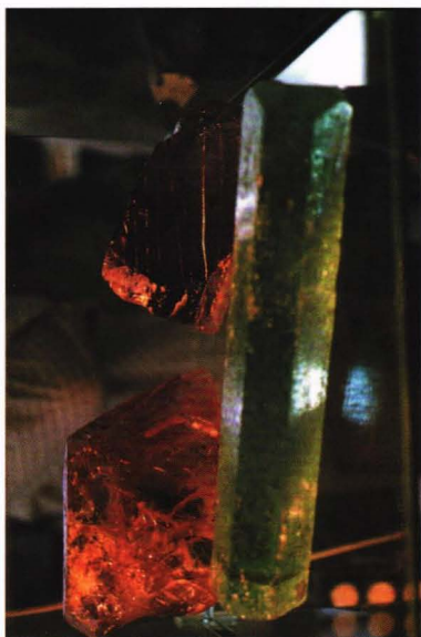
Akvamarin, morganitt og kunzitt fra Brasil.