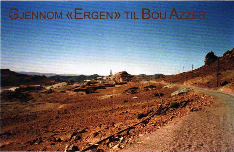
Bou Azzer gruvelandsby i ørkenlandskap