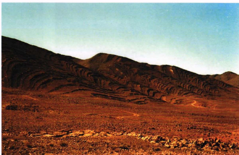
Landskap ved Bou Azzer der landskapet er prega av store foldingar.

Bou Azzer er ei av verdas største koboltforekomster og har vore drivi periodevis i bortimot hundre år. Utover i det vegetasjonslause ørkenlandskapet ragar