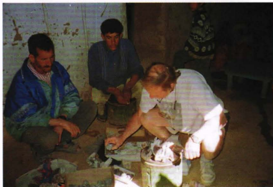
Bou Azzer, mineralkjøp i halvmørket.