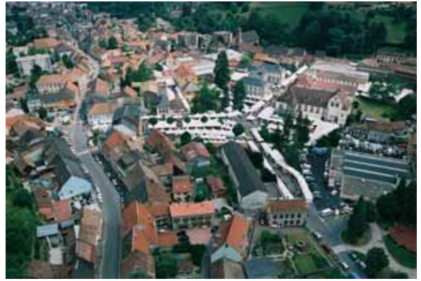
Slik er messa anlagt. Trivelig!