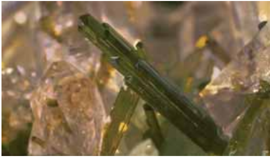
Epidot, Frankrike.

Vakkert anrettet i Elsass eller Alsace. Det er alltid fint vær i Saint Marie aux Mines i juni. Derfor er det så fortreffelig med en vandring utendørs blant mineraler og stein i bøtter og spann på bord og på hyller, i bakgårder, gater og smug. Og skulle det komme en byge, det hender, - trekker man innendørs, i theatre, offiselle bygninger, staller, - alt.