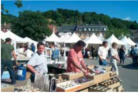
I bøtter og spann, i esker og bokser.