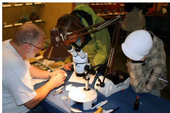
Hva er dette?