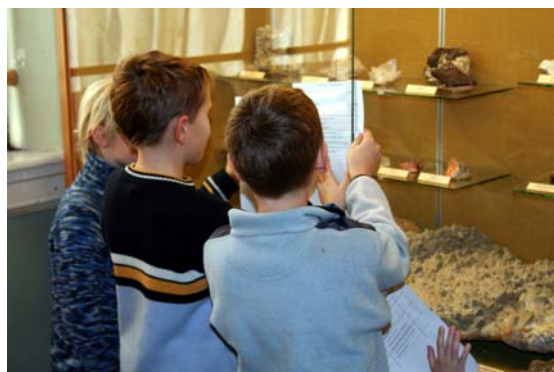
Mineralsti er gøy.

Steindagen er gjennom mer enn 25 år blitt et begrep i Bergen. I månedsskiftet oktober-november gjør amatørgeologene sitt inntog i De Naturhistoriske Samlinger og inviterer i samarbeid med Bergen Museum byens små og store innbyggere til åpen dag med masse aktiviteter. Da er det tombola og ut-