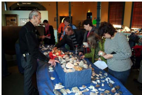
Her vinner alle.

lodning, mineralsti og steinverksted for de små. Da er det bestemmelse av medbrakte steiner, titting i stereoluper, utstillinger, kafe og informasjon. I år kunne man også gi sin stemme til "Norges nasjonalstein".