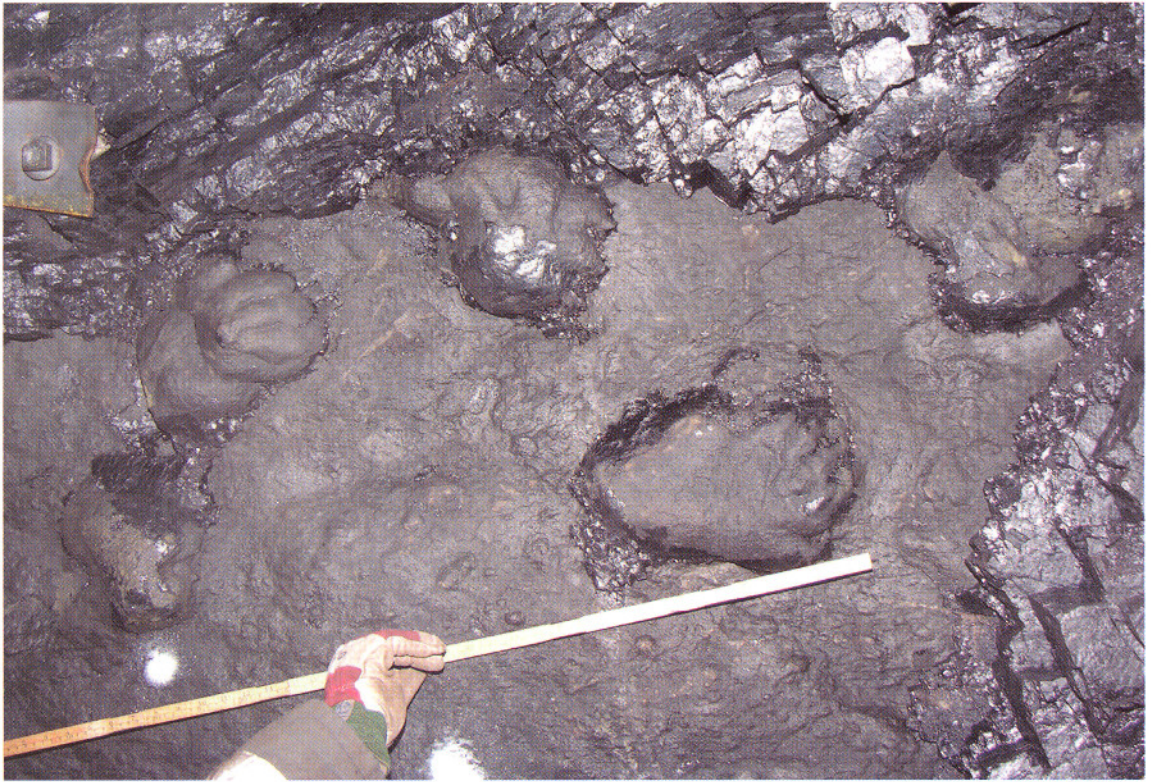
Figur 3. Detalj av fotsporene, legg merke til tærne.