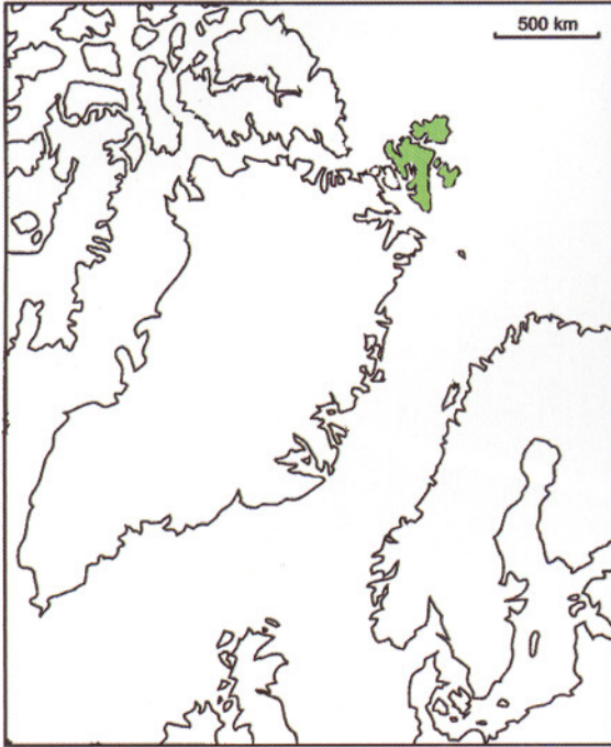
Figur 1. Svalbards plassering for 55 millioner år siden

Jørn H. Hurum, Naturhistorisk museum, Universitetet i Oslo