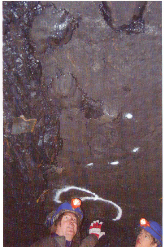
Figur 2. Fotsporene i taket.

Den siste geologiske perioden som dinosaurene levde i kalles kritt. Den første delen av perioden som kommer etter dinosaurene