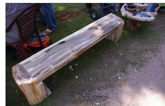
Benk i forsteinet tre.