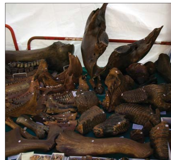
Kvartære fossiler fra Polen.

Messen er også en fin måte å knytte kontakter på. Da mange av utstillerne også kommer til München i oktober, kan en fortsette utveksle informasjon og mineraler der også.