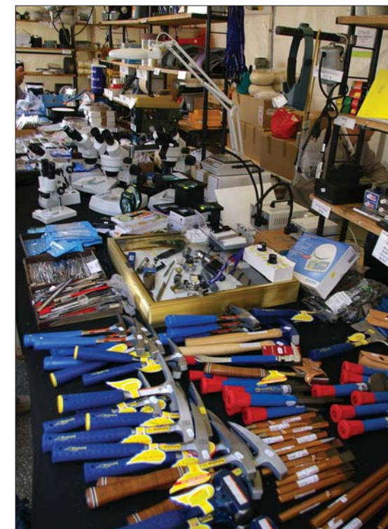
Masse nødvendig utstyr for steinsamleren.