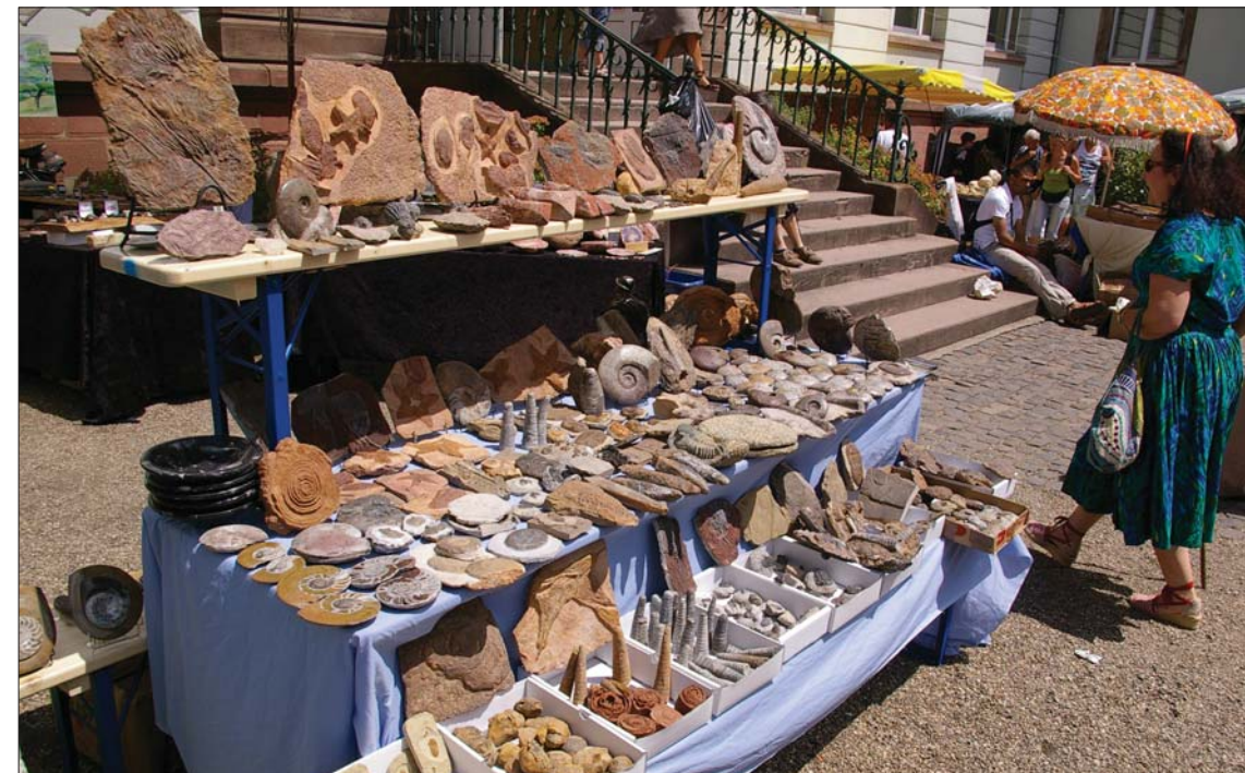
Stort utvalg i fossiler.

Ellers var det praktstykker med fossilt tre – igjen for stort (og dyrt). Imponerende var i alle fall en benk laget i fossilt tre. Den