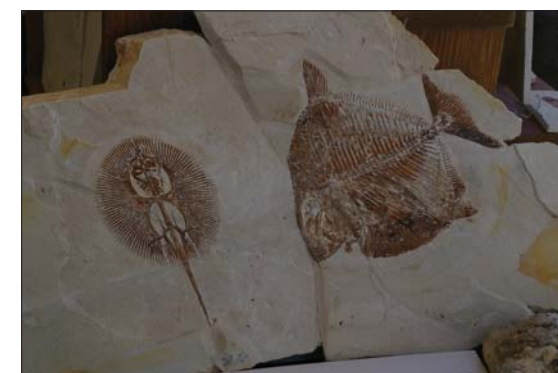
Fossile fisk fra Libanon.