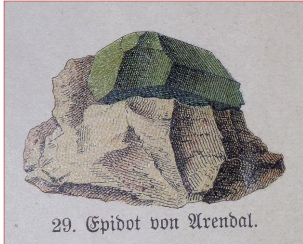
Tresnitt fra Kenngott 1890, Epidot fra Arendal