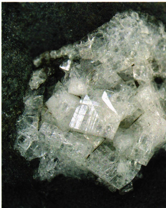
Apopylitt? Billedbredde 5 cm.