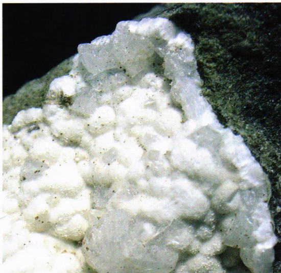
..... og denne går samme veien. Billedbredde 2 cm.