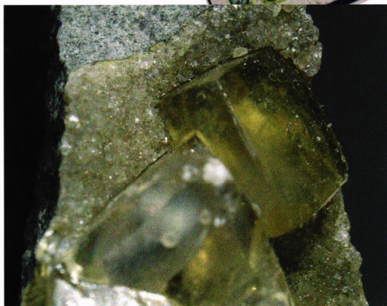
Honningkalsitt 2 cm.