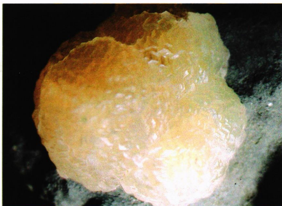
Prehnitt? 2 x 2 cm.