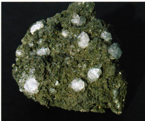
Dette er vanskelig. Vi får levere den til bestemmelse. Stubbredde 10 cm.