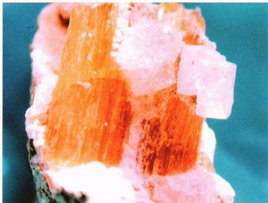
Chabasitt på calsitt 1 x 1,3 cm.