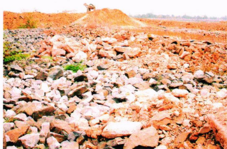
"Forekomsten".