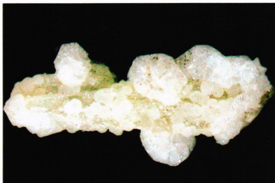
Kalsitt og Philipsitt. Lengde 3 cm.